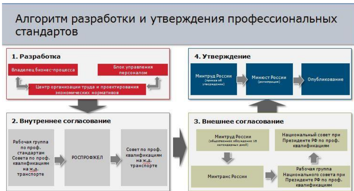
Рисунок 1. «Алгоритм разработки и утверждения профессиональных стандартов»

Разработанные профессиональные стандарты проходят рассмотрение в нескольких инстанциях, среди которых Минтруд и Минюст России, Национальный и отраслевой советы по профессиональным квалификациям, Российский профсоюз железнодорожников и транспортных строителей (рисунок 1). Такой порядок обеспечивает работникам, для которых предназначены профессиональные стандарты, в первую очередь, соблюдение прав и гарантий, предусмотренных Трудовым кодексом Российской Федерации.